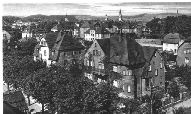
Freiburg i. Schles. Bahnhofstraße

1650 Hanns Henryk I, który już przy objęciu panowania