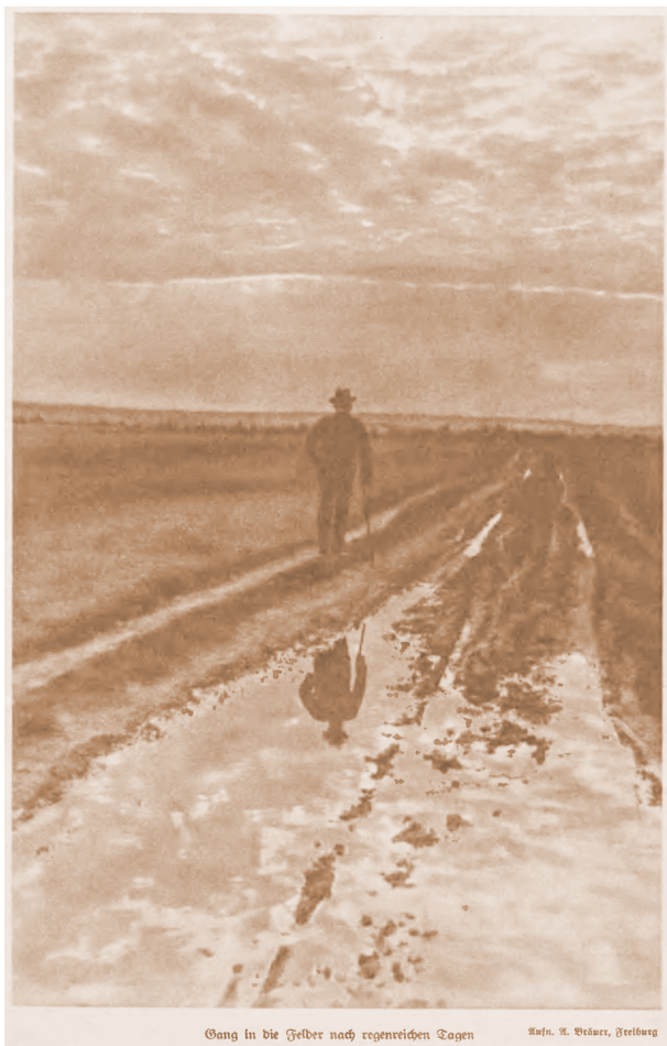
Gang in die Felber nach regnerischen Tagen