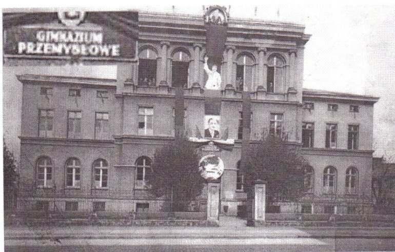
Budynek Gimnazjum Przemysłowego przy ul. Świdnickiej (z pierwszomajową dekoracją - portrety Stalina i Bieruta) obecnie siedziba Szkoły Podstawowej Nr 3.

Uruchomiony zostaje Zakład Nr XXXII obecnego „Termetu”.