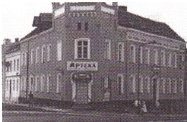
Skrzyżowanie ulic: Strzegomskiej i Krasickiego