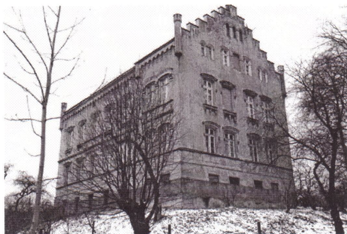
Zdjęcia: górne - dom Mikulicza, obok - grób rodzinny na cmentarzu komunalnym przy ul. Wałbrzyskiej

czaszką gdzie kula spoczywała. Dyrektor kliniki osiadła w prawej części czaszki pomiędzy zwojami mózgu, a która, nie uszkodziwszy naczyń, wywierała tylko nacisk na prawą część mózgu. Ponieważ zaś prawa część mózgu jest głównym organem lewej części ciała, więc nacisk na odnośną część mózgu był powodem niemocy w lewym ramieniu". W klinice wrocławskiej pod nadzorem Mikulicza pracowało wielu zdolnych lekarzy. Jednym z najbardziej znanych uczniów Mikulicza był berliński