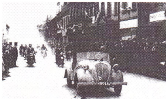
Dwa powyższe zdjęcia przedstawiają 1-majowy pochód w roku 1946

Zostaje otwarta Szkoła Podstawowa Nr 5 przy ul. Piłsudskiego.