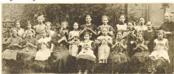
[Schlesische Woche 1914/34/16.VIII./s. 10]

Przesyłka ta dotarła na front w listopadzie 1914 roku. Korespondencja tego rodzaju nie była rzadkością, wręcz przeciwnie, pisanie listów i dołączanie do nich praktycznych, drobnych upominków dla walczących – stało się wojenną tradycją. Ilustruje to dołączona fotografia zbiorowa, przedstawiająca dużą grupę młodych kobiet i dziewcząt, robiących skarpetki, rękawiczki lub szaliki, jako najłatwiejsze.