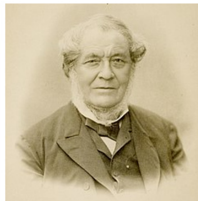
Pełne imię i nazwisko Robert Wilhelm Eberhard Bunsen

Po ukończeniu uniwersytetu w Heidelbergu, Alma mater legitymującej się wielowiekową tradycją, pod koniec lat siedemdziesiątych, rozpoczął pracę, (po uzyskaniu tytułu doktora) jako asystent profesora chemii na tutejszym uniwersytecie, Roberta Wilhelma Eberharda Bunsena ( ur. 30.III. 1811 – zm. 16. VIII. 1899), który katedrą chemii zarządzał przez 37 lat. Jak podaje Wikipedia, w opuszczonym budynku klasztornym urządził doskonale wyposażone laboratorium. Nie był żonaty, mawiał, że nie ma czasu na takie sprawy. Prowadzone wykłady ilustrował zawsze ciekawymi doświadczeniami. Był autorem pierwszej monografii, poświęconej analizie gazowej. Skonstruował spektroskop, ogniwo cynkowo – węglowe, fotometr, kalorymetr lodowy.