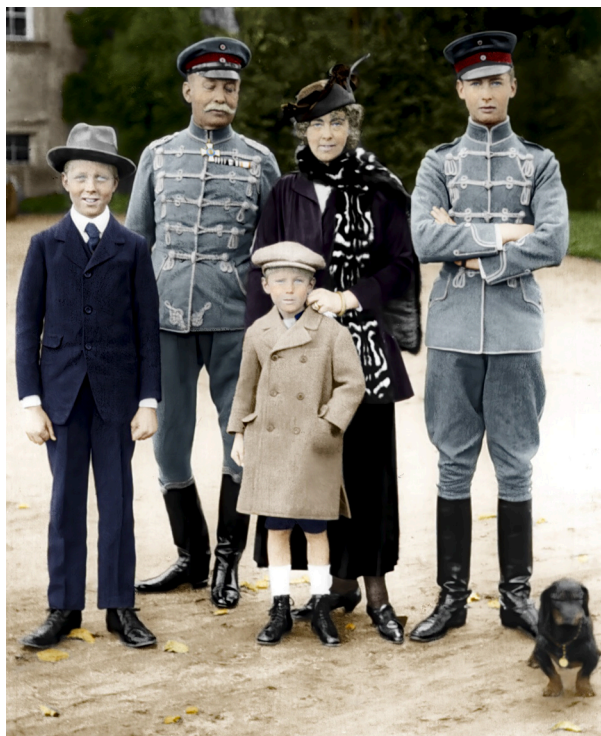
Rodzina księżna Hochberg von Pless w 1916 roku

Najważniejsze jednak było zachwycające otoczenie Książa: wspaniałe parki, ogrody tarasowe w stylu francuskim i stworzona specjalnie dla Daisy, przez nią zaprojektowana „Ma Fantaisie”, usytuowana na zachód od zamku Książ. Była to miniaturowa posiadłość nad strumieniem, w stylu angielskim, gdzie chętnie spędzała wiele czasu. Według pomysłu Daisy zbudowano dwa, połączone ganiami, niewielkie domki kryte strzechą. Spiętrzone tam wody potoku, dzięki czemu utworzono niewielkie jezioro. Wokół domków utworzono niewielki ogród, wzorowany na tarasach angielskiej posiadłości rodziców Daisy - Newlands. Ich przytulne wnętrza dawało księżnej odpoczynek od nudnej etykiety euro-