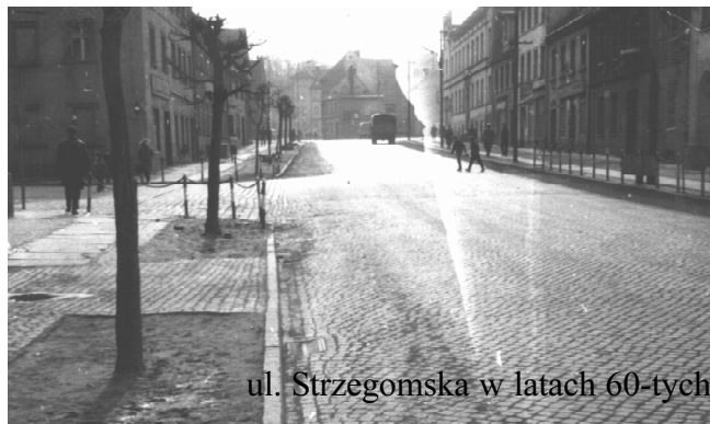
ul. Strzegomska w latach 60-tych

W masarni PSS w Świebodzicach uległ śmiertelnemu porażeniu prądem elektrycznym przy pracy kierownik tej placówki Mieczysław Siwek. Śledztwo w sprawie wypadku prowadzi prokuratura.