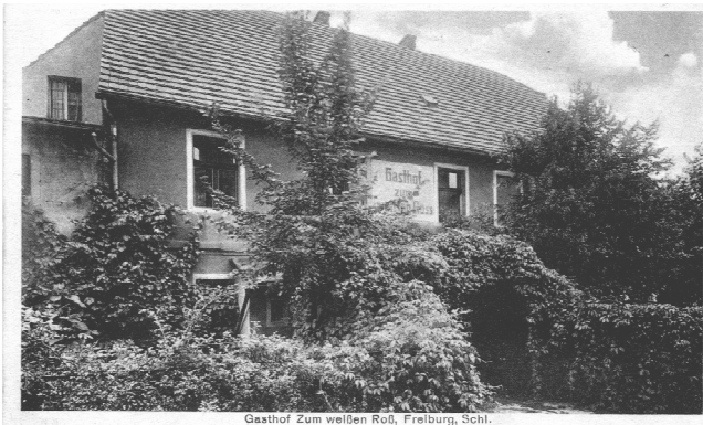
Gasthof Zum weißen Roß, Freiburg, Schl.

Wzmianka o tej gospodzie znajduje się w zapisach kronikarskich pod rokiem 1823, kiedy to odnotowano pożar "Zum Weissen Roß" - gospody na przedmieściu dolnym (obecna ulica Piaskowa). Pożar strawił zarówno samą gospodę, jak i jej zabudowania gospodarcze. Z pewnością została odbudowana, ponieważ jeszcze w czasach przedwojennych prowadziła działalność jako "Gasthaus zum Weiße Roß" przy ul. Sand Strasse (Piaskowej) 18. Wraz z rozbudową "Refy" jej zabudowania, już jako domu mieszkalnego zostały zburzone. W latach sześćdziesiątych jej historia skończyła się bezpowrotnie.