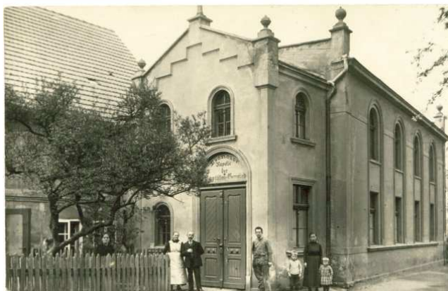
Na zdjęciu górnym rodzina Zachanowiczów. Na zdjęciu dolnym widok kaplicy przed 1939 rokiem.

wypisaną datą: 1901. Nad wejściem umieszczona była nazwa „Ebenezer”, co widać na archiwalnym zdjęciu z lat 20-tych. „Ebenezer” oznacza „aż dotąd prowadził Pan”. W latach nazizmu wyznania ewangeliczne zostały zrzeszone pod jedną nazwą, stąd na zdjęciu powojennym widać inną nazwę Kościoła. Do końca lat 50-tych polscy baptysci z okolicy organizowali w kaplicy chrzty, ze względu na istniejące tam baptysterium. Na początku lat 60-tych władze przejęły budynek, który później był magazynem Dolnośląskich Zakładów Przemysłu Cukierniczego „Śnieżka”, pustostanem, i magazynem straży pożarnej. W roku 2003 baptysci uzyskali kaplicę na własność i użyczyli nam w użytkowanie. Otwarcie odnowionej kaplicy nastąpiło 29.07.2007 roku.