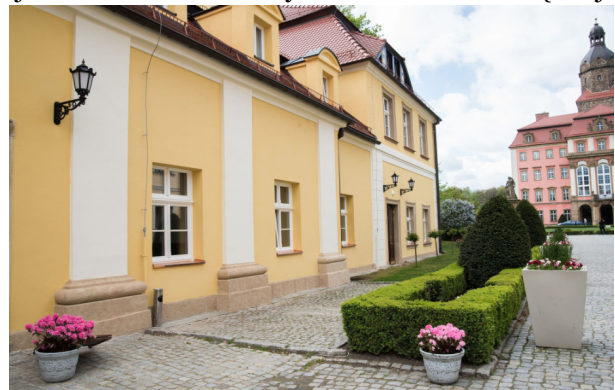
Dom Kawalerów po remoncie

Po wojnie, „dom kawalerów”, podobnie jak Zamek, popadał w ruinę. W latach 60-tych ubiegłego stulecia funkcjonował przez jakiś czas jako ośrodek kolonijny dla dzieci i młodzieży. Pomieszczenia po stronie zachodniej zajęła pod koniec lat 60-tych Polska Akademia Nauk, której przedstawiciele użytkują je do dziś. W dawnym mieszkaniu księżnej