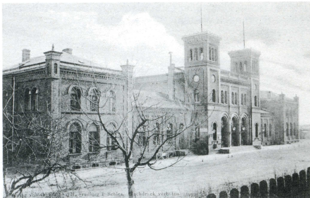
Der Freiburger Bahnhof um 1900

W ruchu pociągów pospiesznych niemieckie koleje państwowe używały pod koniec 1936 roku najpierw wagonów motorowych ET-13, a od marca 1940 roku ET-31. Skład pociągu, jadący w ogromne góry miał 188 miejsc siedzących w trzech ściśle sprzężonych ze sobą wagonach motorowych. Ten bardzo lubiany skład pociągu jechał od Wrocławia do Jaworzyny Śląskiej z prędkością aż 110 km/h 9 . Mój stary, świebodzicki przyjaciel, opowiadał mi o szczególnym pociągu pośpiesznym, który w języku ludowym nazywano „Fliegender Hirschberger” 10