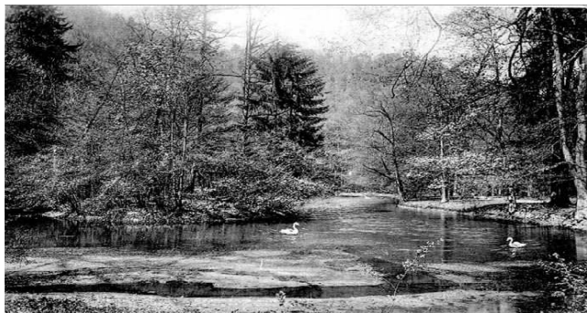
Nieistniejący już staw z wysepką przy „Starej Szwajcarii”

tem fotograficznym, często robi bardzo ciekawe zdjęcia – nieznanne innym mieszkańcom miasta, które będzie zamieszczał również w tej kronice, aby po latach pozostał jakiś ślad. Życzę mu sukcesów w tym co robi i ciekawych ujęć fotograficznych.