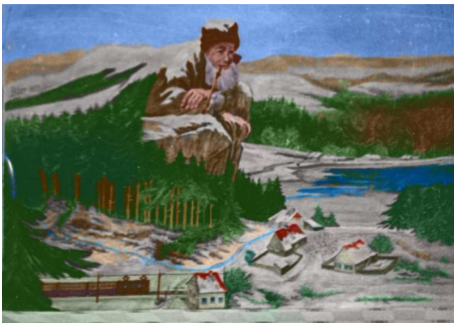
Zdjęcie zamalowanego fresku który znajdował się w holu stacji kolejowej. (Przypuszczalne barwy naniesione przez A. Rubnikowicza)

w oknach chat blaski światła. Na stoku cisza Z pobladłym licem Wsłuchuje się W milczenie Liczyrzepy.