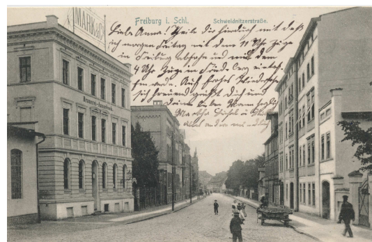
Stara widokówka

Zrozumiałe jest, że kiedy w roku 1706 rada wydała rozporządzenie o nowej organizacji rynku, które dopuszczało działalność tzw. wolnych tkaczy w mieście, zrobiła to po to, aby podnieść gospodarcze znaczenie miasta. Jak jednak te nowe „statuta de jure successionis” (porządki prawne) miastu w nowym rozkwicie dopomóc miały, jest już innym pytaniem.