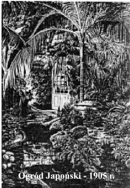
Ogród Japoński - 1905 r.

ne oranżerie, których ściany wyłożono lawą z wulkanu Etna. Wśród krzewów i pnączy ukryto grotty, dyskretne altanki, ławeczki.