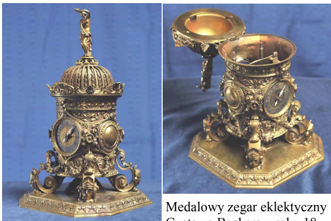
Medalowy zegar eklektyczny Gustawa Beckera z roku 18-

70, wykonany z brązu. Wysokość całkowita - 40,5 cm, waga - 8,3 kg. nr seryjny 425993. Zegar znajduje się w Stanach Zjednoczonych.