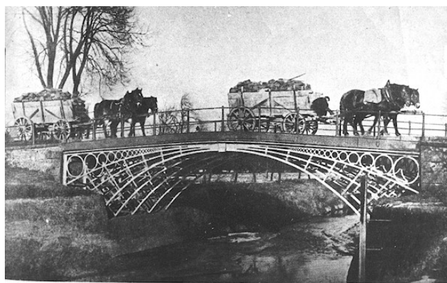
Die erste gußeiserne Brücke auf den europäischen Kontinent. 1796, auf der Kohlenstraße in Łazany /Laasan/ bei Schweidnitz / Niederschlesien.

Na naszym terenie, zanim powstała prawdziwa kolej, transportowano węgiel z górniczego Wałbrzycha do portu w Malczycach, skąd Odrą eksportowano go dalej, m.in. do Wrocławia. Drogę Wałbrzych – Świebodzice – Stanowice – Strzegom – Budziszów – Malczyce, której budowę rozpoczęto w 1780 roku, nazywano „Drogą węglową”. Miała ona długość 55 kilometrów, a transport odbywał się przy wykorzystaniu wozów konnych. Przez teren